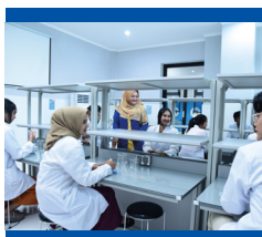
Lab. Patologi Klinik