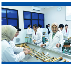
Lab. Anatomi Basah