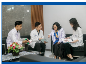
Lobi Fakultas Kedokteran