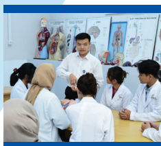
Lab. Anatomi Kering