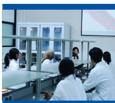
Lab. Patologi Anatomi