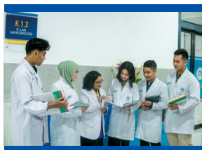
Hall Fakultas Kedokteran